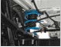
YARDIMCI VE GÜÇLENDİRİLMİŞ YAYLAR