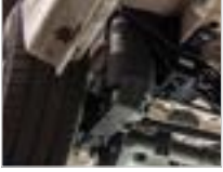
TAM HAVALI SÜSPANSİYON

Ürünlerimiz dört ürün grubundan birine aittir. Bu ürün gruplarında birçok farklı marka ve model için çeşitli sistemler bulunur. Bu, sizin için her zaman uygun bir çözüm olduğu anlamına gelir.