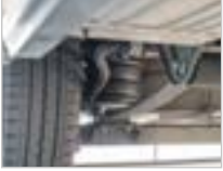
YARIM HAVALI SÜSPANSİYON